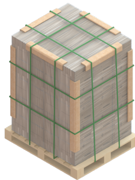
Fig. 2 Estibado