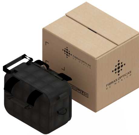
Fig. 1 Empaque individual