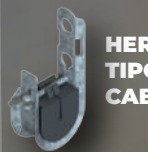
HERRAJE SUSPENSION TIPO J PARA CABLE MINI ADSS