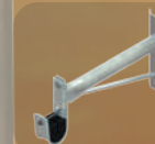
HERRAJE DE EXTENSION PARA ADSS