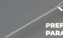
PREFORMADO PARA CABLE ADSS