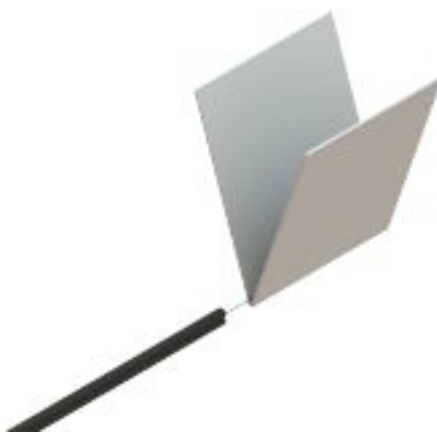
Fig. 1: Limpieza de fibra óptica expuesta con toalla pre saturada.