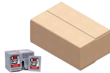
Fig. 4: Empaque en caja máster