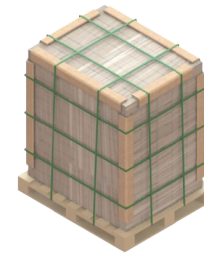
Fig. 6: Entarimado