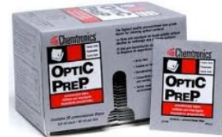
Fig. 3: Empaque en caja OPTICPREP®