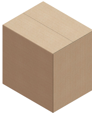
Fig. 8 Empaque Distribuidor IUD