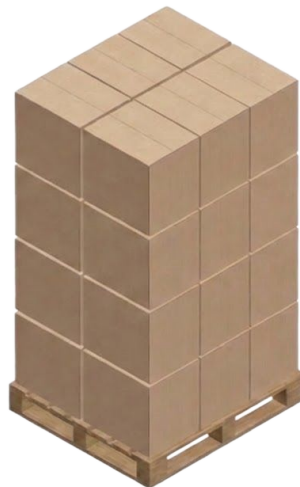
Fig. 9: Estibado